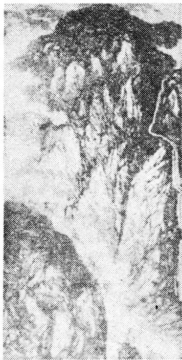
秦岭烟云图 (国画) 张朝翔

悠悠的钟声响了，站枫桥高处，耳畔便有了丝丝空气的震颤。我知道，那一定是游人又撞响寒山寺里那口古老的钟了。哦，姑苏城又要落下一轮月了。你看，远远的水巷上，不是正架着一座新桥么？！