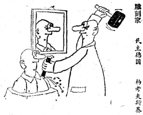
雕刻家 民主德国 杨考夫斯基