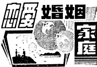
刊头设计 牛瑛 本版编辑 王毅毅

现在许多孩子不会但是另一方面，就是有些孩子干了家务，顶多得到父母不疼不痒地几句表扬，而致使孩子觉得自己的劳动没有得到承认，产生了不干都一样的心理，反正爸爸妈妈不给报酬。再之，有些父母想让孩子干家务但总是采取命令或说教的方式，而使孩子产生了对抗心理，你越让我干，我越不干。