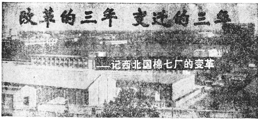
记西北国棉七厂的变革