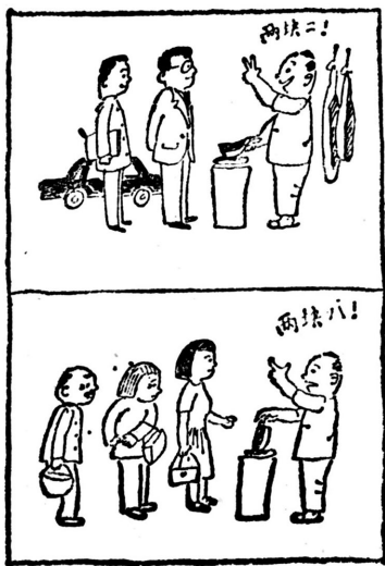
看价卖价两不同 自知知作

每平方米标准价500元。一个多小时就售出了7户。购房者3天以内交定钱，即交总价钱的一半。尔后领住房的钥匙时再全部付清。据这个开发公司的服务人员讲，购房者主要是个体户、房屋拆迁补偿费户、“三案”平反补发了补助费者和其他有特殊收入的人。近两年，又增加了有一定收入的企业承包者。当我问到企业职工买房人多少时，他说，在该公司1983年至1987年所卖的280套商品房中，卖给企业职工的两套。 （赵现进）