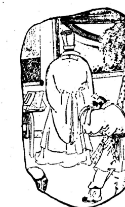
4、董父读过信和诗后，使命工匠让出两墙的地方。邻居见董父退让了，亦折墙作了退让。