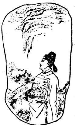
1、明朝末年，在京做官的董马，为官清廉，两袖清风，为世人所称道。