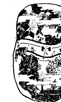
5、这样，双方你退我让，中间便出现了一条过道，被乡亲们称为“仁义胡同。”