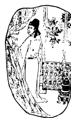
3、董马赋诗一首，差人送给父亲。“千里捎书只为墙，不禁使我笑断肠。你仁我义结近邻，让出两墙有何妨？”