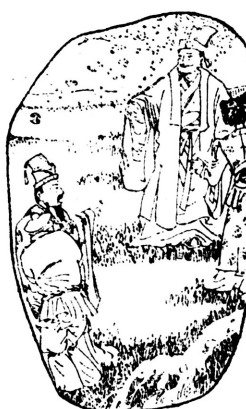
2、有一次，董马接到父亲的来信，说山东老家因修建房屋和邻居发生了墙界争执，要他出面说话撑腰。