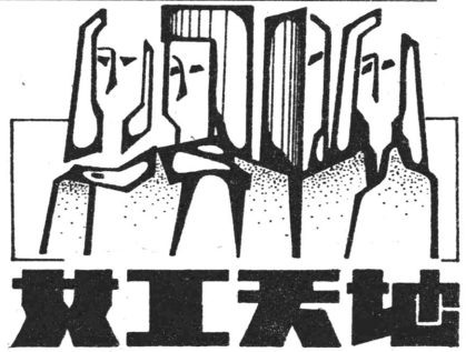
刊头设计 范红江 本版编辑 柳江河

“企业有困难，女职工怎么办”。当前，许多企业不景气，而作为工厂的中坚力量的女职工们，应努力发挥出自己所有的才能，为企业走出困境，排忧解难，出谋划策，帮助企业共渡难关，真正发挥自己在企业中“半边天”的作用。