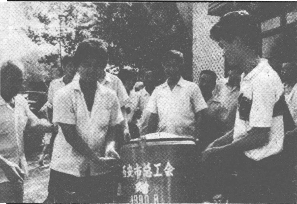
日前，西安市总工会领导带领机关干部前往市环卫站，给正在降温用具和饮料。