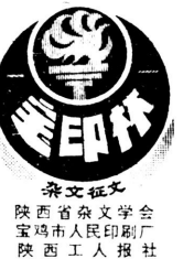
陕西工人报 陕西省文学会 宝鸡市印刷厂 陕西工人报社

制止这一现象，我以为最好的办法，就是把企业推向有竞争风浪的市场。在那“乱石崩云、惊涛裂岸”的态势下，谁还有什么机会“哼哼”？倘若企业头上，也悬着一柄用马鬃系着的达摩克利斯之剑，又断了会哭的孩子多吃奶的盼头，当其真正成为自主经营、自负盈亏、自我发展、自我约束的经济实体时，“肥猪瘦猪都哼哼”的情景，就会成为昨日黄花。