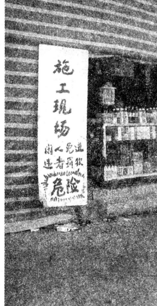
小摊小贩,网开一面。安全规范,视而不见。睁一只眼,闭一只眼。事看谁办,法看谁犯。2003年6月摄于宝鸡经二路某施工现场。晏亮 摄

1、对外承包经营方式是否违背国家的政策? 2、留在幼儿园工作的企业职工,工资能否由承包人支付,工资标准怎样确定? 3、根据幼儿园效益及个人工作考核业绩确定工资收入,不低于当地最低工资标准的工资分配方式,合法吗? 在企业深化改革的关键时期,上述问题一直困扰着企业的决策者。我们恳请律师给予书面答复,以便我们正确理解和运用国家的政