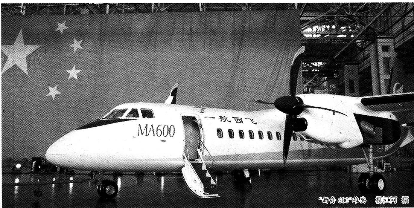
“新舟 600”总装

涡桨飞机是涡轮螺旋桨飞机的简称。涡桨支线飞机在中短途飞行中，具有良好的运营积极性、节能环保性和安全舒适性。随着国际油价一路飙升，节能效果显著的涡桨支线飞机需求越来越旺盛。目前在欧美国家的支线机群中，近一半是涡桨飞机。