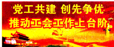
党工共建 创先争优 推动工会工作上台阶

“对职工年龄不足18周岁且尚未就业的独生子女和无生活来源且男满60周岁以上、女满50周岁以上的（职工）父母，每人每年补助120元参保费用。”这是延长石油集团延安炼油厂在年前实施的一项新的惠民举措，受到了广大职工以及家属的真心欢迎。而这项举措能够顺利落实，还得益于职工代表的及时呼吁和企业的具