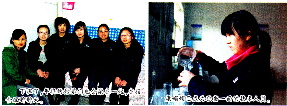
下班了，年轻的姑娘们也会聚在一起，在宿舍里聊聊天。

中铁一局西宝客专管段共有女工155人。关爱女工健康，关心女工成长，是中铁一局西宝客专常抓不懈的工作，各项目经理部工会每半年就组织女工进行一次体检，并开展羽毛球、乒乓球、卡拉OK和演讲比赛，节假日期间，不但组织女工乘坐郑西高铁，感受建设工程，还带领女工攀登华山、翠华山，放松心情带来的紧张心情，极大地丰富了她们的业余文化生活。同时，中铁一局西宝客专指挥部要求所属9个项目经理部对女工进行岗前培训、安全培训。并针对试验员、测量员等专业性较强岗位，进行专项技能培训。在工作中带给女工更多地细节关怀，让她们高高兴兴工作，快快乐乐生活。