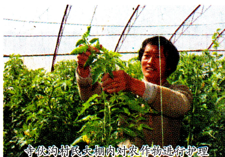
寺伙沟村民在大棚内对农作物进行护理