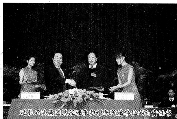
延长石油集团总经理张积耀与所属单位签订责任书