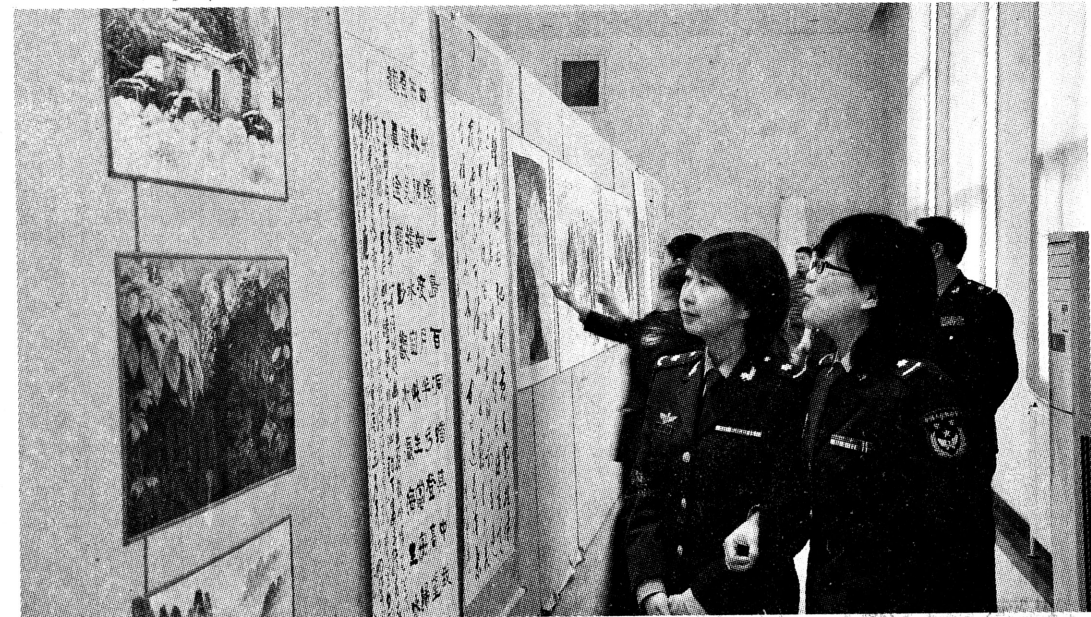
近日,空军临潼航空医学鉴定训练中心与共建单位“海天书

在有效缓解城市居民买菜难的同时,大规模连锁配送网络投入运营降低了流通成本,连锁菜店的蔬菜价格平均比农贸市场低15%以上,比大型超市降低20%以上。(张杨 轩轶 杨子)