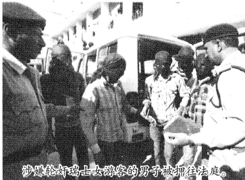
涉嫌轮奸瑞士女游客的男子被押往法庭。

瑞士女游客遭轮奸事件中的6名嫌犯18日在印度中央邦的德蒂亚法院出庭受审。17日,印度中央邦内政部长声称,在该事件中,受害者本身也有责任,她和丈夫没有遵守旅行的相关规定。印度各党派18日未能就推出“反强奸法案”达成共识。印度“第一日报”网站18日疾呼,印度正处于道德危机之中。