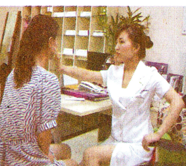
暑期整形行业火爆,不少毕业生或者在校生,都会趁着暑假到整形医院对自己的面部、身材进行“改造”,以谋求更好的就业机会。

随着7月毕业季的来临,又一批大学毕业生走出校门,体验激烈又残酷的职场生活。日前记者发现,暑期整形医院优惠信息越来越多,记者向医院打听得知,由于近几年就业压力逐渐增大,不少毕业生或者在校生,都会趁着暑假到整形医院对自己的面部、身材进行“改造”,以谋求更好的就业机会。