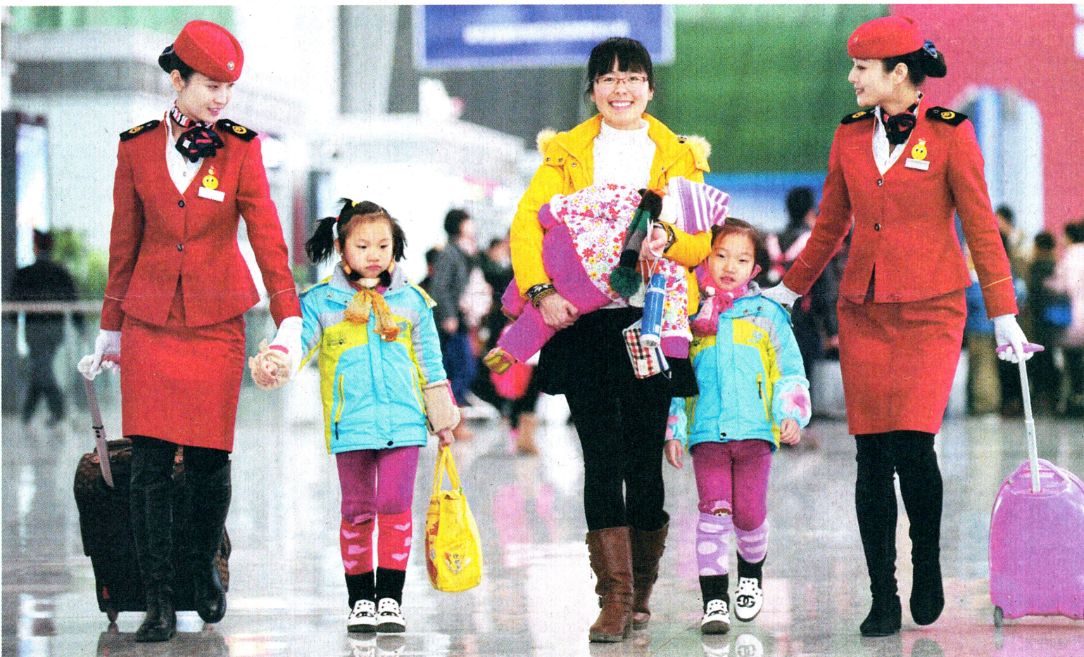
春运期间,西安北站认真落实春运“安全出行、方便出行、温馨出行”目标,车站设立爱心服务台,开通微信、微博和预约电话,为重点旅客提供一对一亲情服务,树立高铁车站良好形象。图为西安北站工作人员热情帮助重点旅客进站乘车。