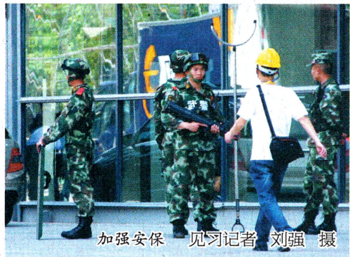
加强安保

为了确保参会取得实效,铜川市在参加西洽会大型活动的同时,还将举办铜川项目推介会暨项目集中签约仪式、铜川代表团第二场项目集中签约仪式等四场重大投资促进活动。各县区分团也将举行不少于两场特色鲜明的自办活动。