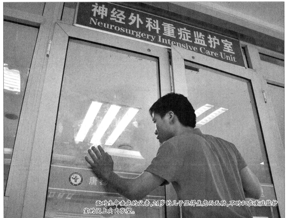
面对生命垂危的父亲,21岁的儿子显得焦虑而无助,不时又在重症监护室的门上向内张望。

化惠民工程,自2009年至今连续举办了六年,已累计免费为群众演出4500多场,受益群众800多万人次。目前正在火热进行的“2014西安市千场戏剧惠民演出”,已经深入全市13个区县的乡镇、社区、厂矿、学校,免费为群众演出了800多场次,丰富了群众的业余精神文化生活。按照计划,整个活动结束后,演出将要达到1150场次。