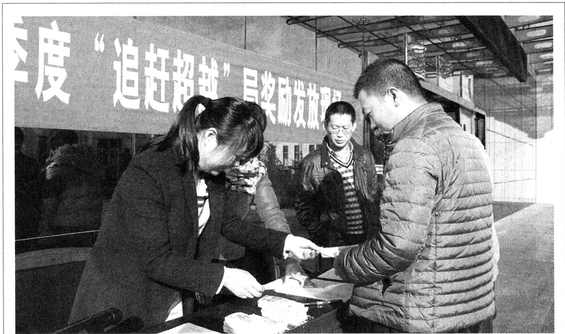
“领红包啦!”近日,澄合董东办公楼前一片热闹,原来是该公司在矿业公司三季度追赶超越

互联网创新,实现了平台化的智能管理。在井口物资超市建设完成后,为了解决繁琐的人工劳动这一问题,该公司利用互联网思维积极探索超市智能化,通过利用西煤电商平台开发的契机,主动参与平台开发,将井口物资超市经验总结并融入平台,经过努力该公司成为西煤电商平台首家上线运行的单位,并成功将西煤电商平台应用延伸到区队材料员,通过平台管理超市,材料员在办公室就可以下单领料。与此同时,为了配合西煤电商平台,公司创新优化了物资采供平台,实现“三个一”,即超市物资“一键领料”,使以往繁琐的物资出库流程缩短至秒级;目录内物资的“一键补库”,实现了物资的智能管理,将以往的人工盘点和人工提报计划均实现自动化;寄售物资的“一键调拨”,实现股份和存续两个账套物资的即时调拨,减少了库存储备,节约了采购资金,为推行平台化战略奠定了基础。(韩璐)