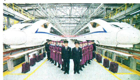
12月4日,西成高铁首发乘务班组在中国铁路成都局集团有限公司成都动车段亮相。这16名工作人员分别来自成都机务段、动车段和客运段,将担任西成高铁首班成都东至西安北列车的乘务工作。

量、执法任务等因素,统筹各级文化市场综合执法机构设置和人员编制。执法人员依法依规实行参照公务员法管理,所需工作经费和能力建设经费列入同级人民政府财政预算,解决办公用房和执法用房,购置执法车辆。 完善信用体系。探索实施文化市场信用分类监管,建立文化市场守信激励和失信惩戒机制。强化事中事后监管,建立健全文化市场警示名单和黑名单制度,落实市场主体守法经营的主体责任。推动行业协会、商会等社会组织建立健全行业经营自律规范、自律公约和职业道德准则,引导行业健康发展。 推进信息化建设。加快全国文化市场技术监管与服务平台建设应用,在省、市、县三级建立“12318文化市场信息监管中心”。采用移动执法、电子案卷等手段,加强非现场监管执法,提升综合执法效能。