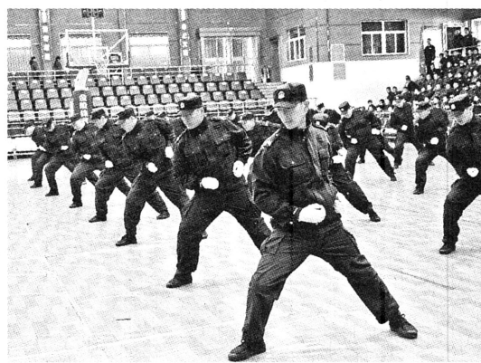
2月23日,陕钢集团2017年“提质增效、追赶超越”劳动竞赛启动仪式在龙钢公司举行。图为公司部分员工形象展示。