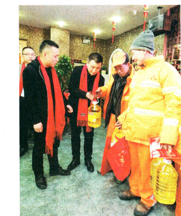
1月28日,陕西省社会福利事业发展基金会志愿者总队召开“情暖古城 爱进万家”志愿者总队2017年年会。在年会上,志愿者向西安市莲湖区北院门红埠社区8户特困户赠送了米面油。