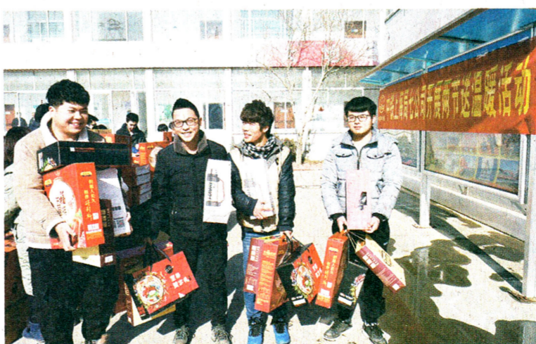
1月24日,中国中铁上海工程局集团第七公司相关领导将购置的保暖杯、周村烧饼、坚果等物品发放给该公司济青高铁项目部职工,拉开了该公司2018年度在山东片区两节“送温暖”活动序幕。

上不起学,不让一名职工看不起病,构筑起扶贫帮困保障线,做细做实“五有”暖心工程:思想有人谈、建议有人听、困难有人管、冷暖有人问、成长有人帮,多渠道了解职工的需求和困难,为职工家属办好事、解难事、办实事。